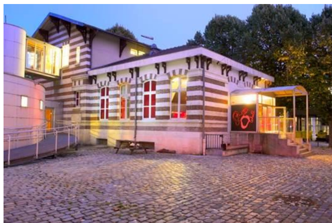
Le Hall de la chanson